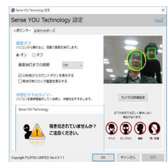
Sense YOU Technology Biz

（注1）：サーバ運用をおこなう場合は、別途サーバ、サーバライセンスおよび端末の設定変更作業が必要です。