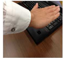
手のひら静脈センサー