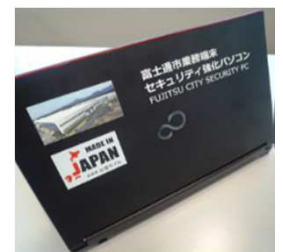
天板印刷（サンプル）